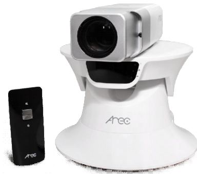
Sistema de Seguimiento Automático AREC TP-100